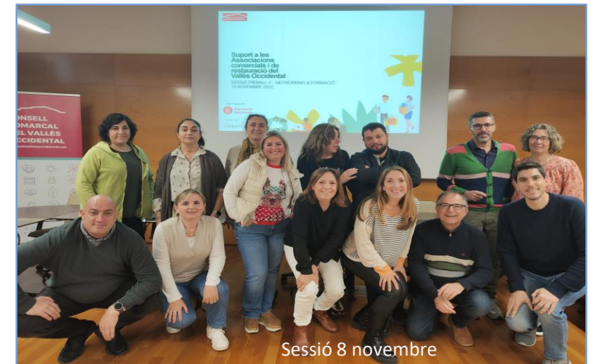
Sessió 8 novembre