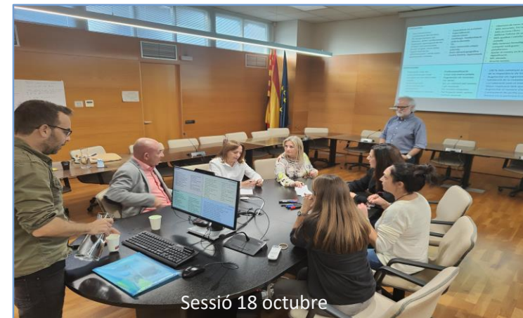
Sessió 18 octubre