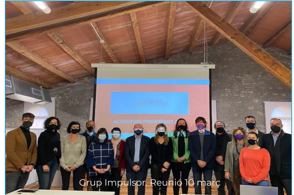
Grup Impulsor. Reunió 10 març