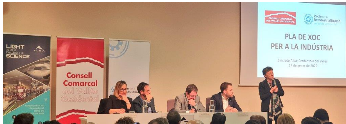
Plenari del Pacte, Sessió oberta. 17 gener 2020. Sincrotró Alba